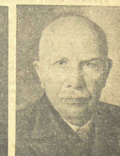
А. С. Серафимович